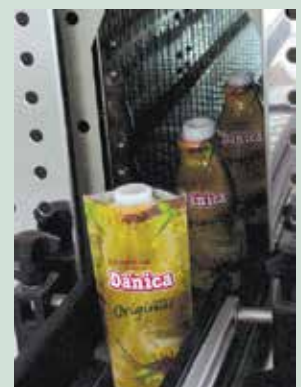
Tunel de Contracción

5B Entrega en unidades para la colocación manual de las mangas.